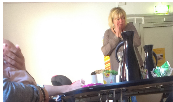
Lena informerar på BVC.

Volvia Försäkringar och NTF står bakom initiativet till Barnsäkerhetsens dag. NTF Väst projektleder NTF:s medverkan i det nationella samarbetet.