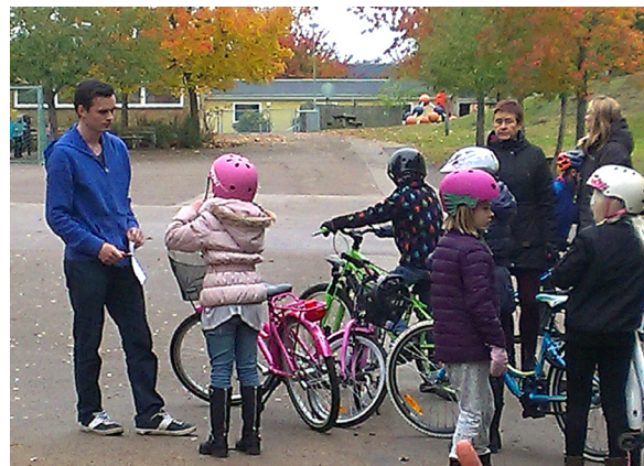
Information om trafiksäkerhet på Hovgårdsskolan i Halmstad.