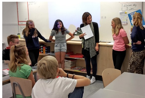
Prisutdelning på Hallenskolan.