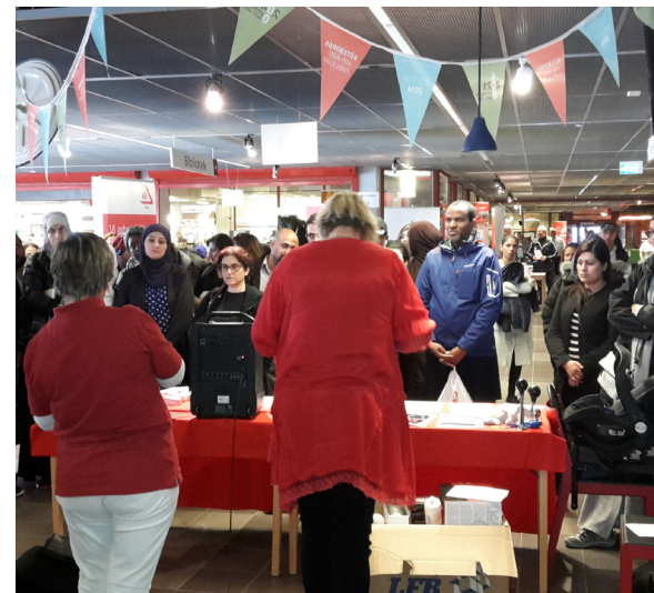
Prisutdelning på Frölunda Kulturhus.

NTF väst har under 2016 arbetat med projektet i tio kommuner, det vill säga alla fem kommuner i Halland och fem kommuner i vårt område inom VGR; Göteborg, Borås, Mölndal, Svenljunga och Tranemo. Projektet syftar till att höja kunskapen om trafik och trafiksäkerhet bland asylsökande och ett enkelt material har tagits fram. Volontärer och frivilliga från Röda korset, kyrkan och olika studieförbund i de aktuella kommunerna har fått informationen och materialet för att i sin tur kunna arbeta med till exempel asylboenden, mötesplatser och parkcaféer.