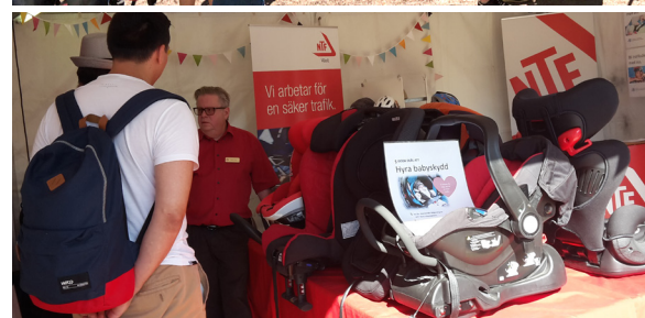
Kulturkalaset i Trädgårdsföreningen.