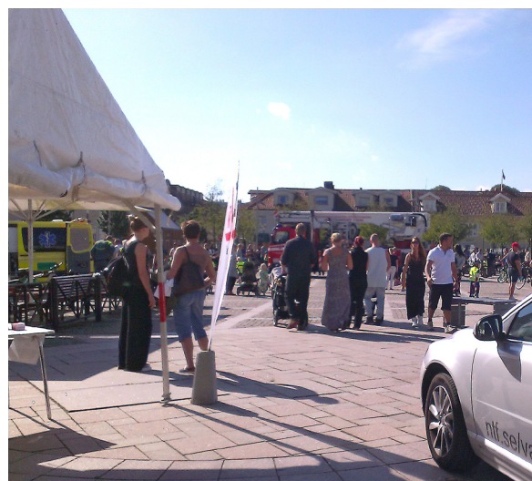
Trygg i Trafiken, Kungsbacka Torg.