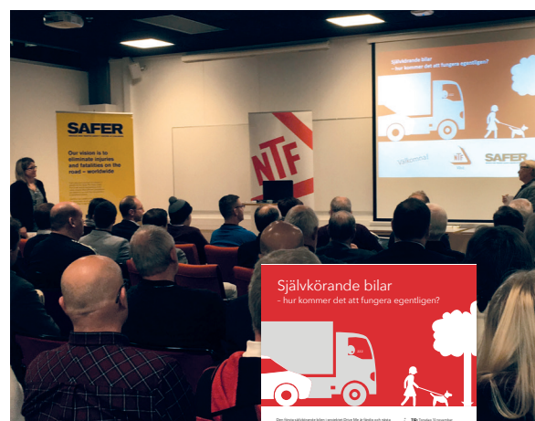
Seminarie i samarbete med SAFER.