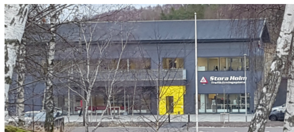
Våra nya lokaler stod klara i december 2016.